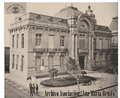
Escuela Gobernador Freyre

23 DE AGOSTO DE 1907 Nueve embargos contra la escuela Gobernador Freyre. Hace más de siete meses, el gobernador, de acuerdo con el jefe político del Rosario, resolvió aplicar una ley de expropiación de terrenos y edificios comprendidos en la manzana de las calles Santa Fe, Moreno, San Lorenzo y Balcarce, para levantar allí un edificio destinado a todas las reparticiones policiales. Con rapidez inusitada se procedió al desalojo de los