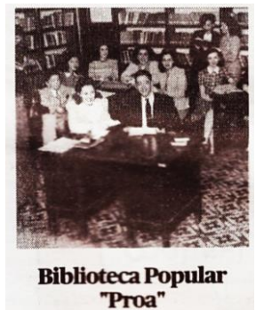
Biblioteca Popular "Proa"